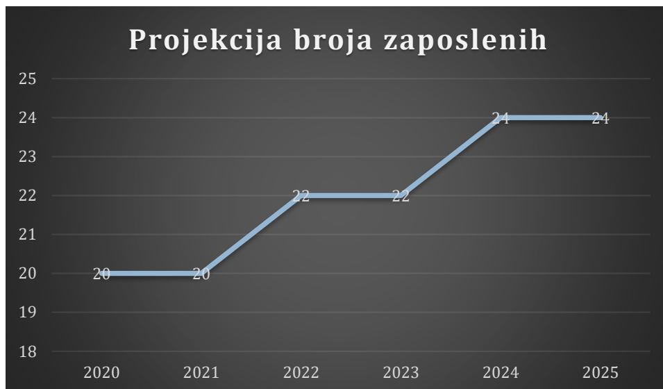
Grafički prikaz: Plan kretanja broja zaposlenih po godinama

Planirano kretanje broja zaposlenih prikazano je grafičkim prikazom u nastavku, a odnosi se na period od 2020. g. - 2025. g. Grafički prikaz prikazuje povećanje broja zaposlenih u odnosu na prethodne godine (prosječan broj zaposlenih) što je rezultat restrukturiranja tvrtke i povećanja prodaje do kojeg je došlo kroz projekciju budućeg poslovanja tvrtke.